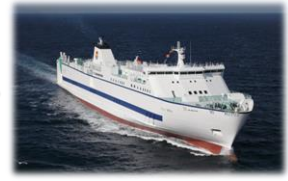
船積みし、到着港へ出港