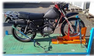
ベルト固定 お持ち込み者様立会の下、ベルト固定致します