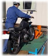
バイクパレットへ搬入 お持ち込み者様でセットしていただきます