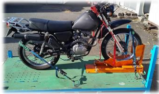
ベルト固定 お持込み者様立会の下、ベルト固定致します