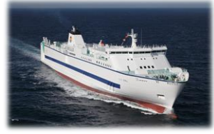
船積みし、到着港へ出港