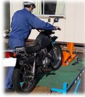
バイクパレットへ搬入 お持込み者様でセットしていただきます