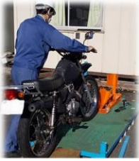
バイクパレットへ搬入 お持込み者様でセットしていただきます