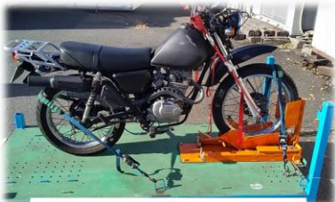
ベルト固定 お持込み者様立会の下、ベルト固定致します