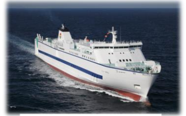
船積みし、到着港へ出港